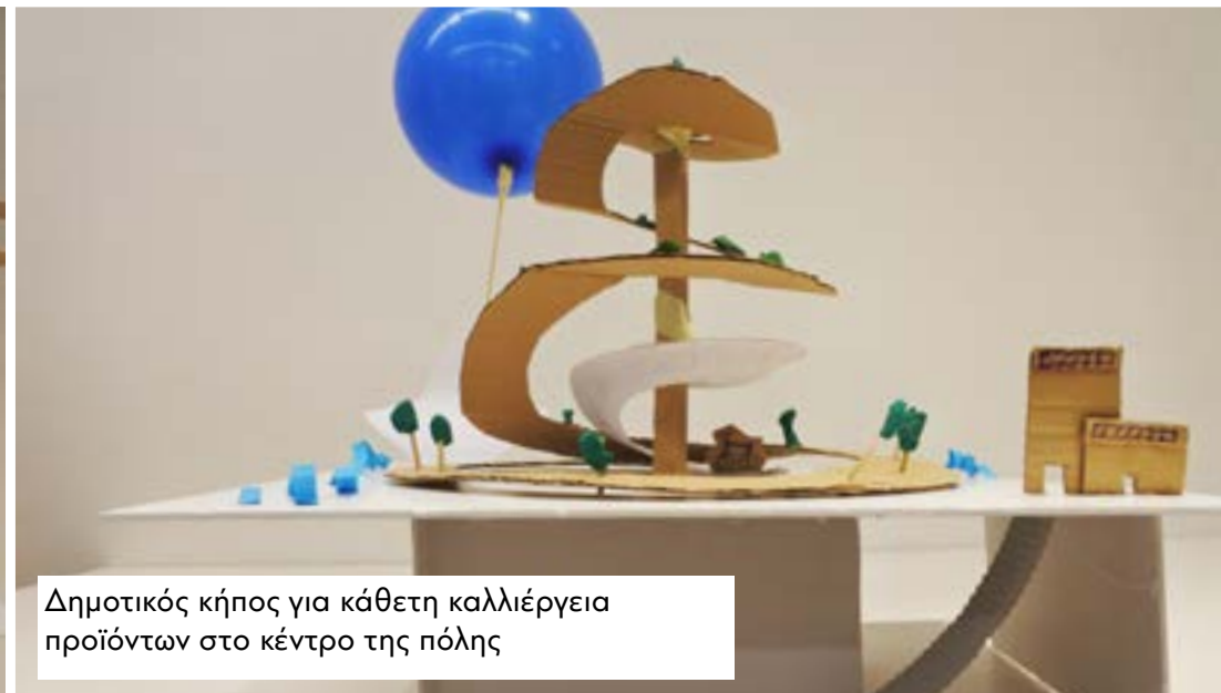
Δημοτικός κήπος για κάθετη καλλιέργεια προϊόντων στο κέντρο της πόλης