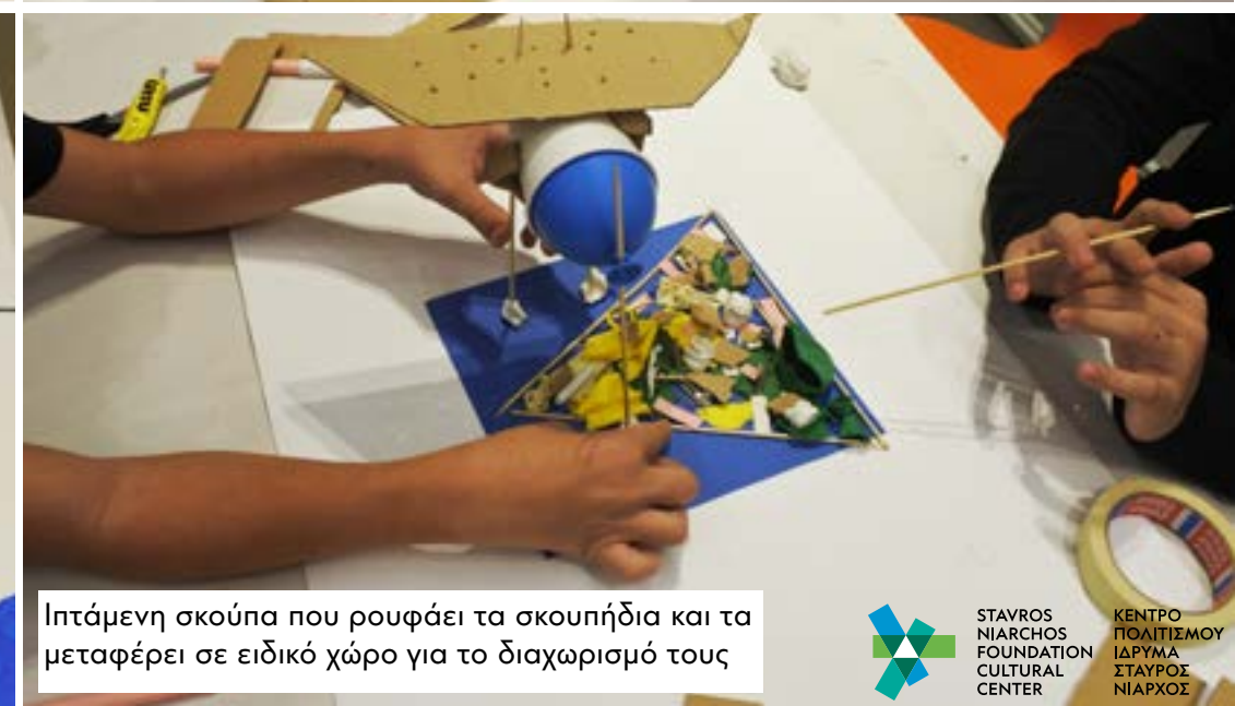
Ιπτάμενη σκούπα που ρουφάει τα σκουπήδια και τα μεταφέρει σε ειδικό χώρο για το διαχωρισμό τους