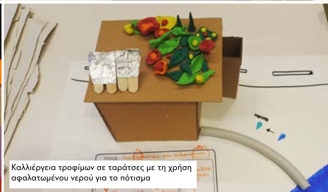
Καλλιέργεια τροφίμων σε ταράτσες με τη χρήση αφρατωμένου νερού για το πότισμα