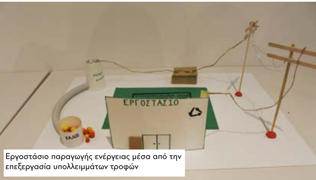
Εργοστάσιο παραγωγής ενέργειας μέσα από την επεξεργασία υπολειμμάτων τροφών