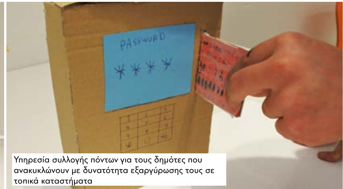
Υπηρεσία συλλογής πόντων για τους δημότες που ανακυκλώνουν με δυνατότητα εξαργύρωσης τους σε τοπικά καταστήματα