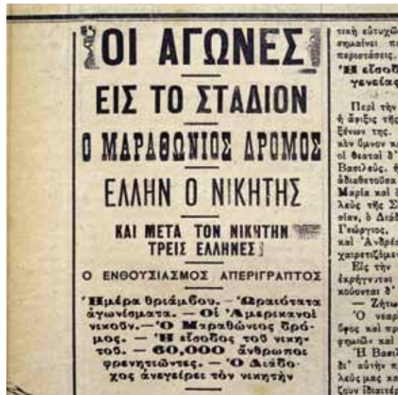
The ASTY newspaper's report on the marathon race, published the day after.

Η αναφορά της εφημερίδας ΑΣΤΥ στον μαραθώνιο, που δημοσιεύτηκε την επομένη ημέρα του αγώνα.