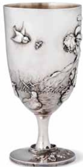
The reverse side of the Bréal Cup Η πίσω πλευρά του κυπέλλου Μπρεάλ

Αμέσως μετά την αποδοχή της ιδέας του Μαραθωνίου και του ειδικού βραβείου, το εν λόγω κύπελλο φιλοτεχνήθηκε από ασημί. Τα μετάλλια των νικητών των Ολυμπιακών Αγώνων του 1896 ήταν επίσης ασημένια. Τα χρυσά μετάλλια για τους νικητές υιοθετήθηκαν αργότερα. Συμβαδίζοντας με τη μετριοφροσύνη που χαρακτήριζε την Ολυμπιακή παράδοση, το μέγεθος του κυπέλλου ήταν σχετικά μικρό, με ύψος 15