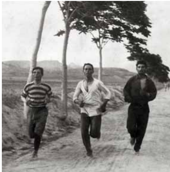
Athletes in training for the marathon at the 1896 Olympic Games in Athens. Αθλητές προπονούνται για τον μαραθώνιο στους Ολυμπιακούς Αγώνες του 1896 στην Αθήνα.

την ιδέα του αγώνα, φαντάστηκε ότι θα ξεκινούσε από τον Μαραθώνα και θα τελείωνε στην Πνύκα, τον λόφο στους πρόποδες της Ακρόπολης, όπου είχε συγκληθεί η συνέλευση των Αθηναίων και όπου ο αγγελιοφόρος έκανε την ανακοίνωσή του. Για πρακτικούς λόγους, ωστόσο, ο τερματισμός του Μαραθωνίου έπρεπε να γίνει στο Παναθηναϊκό Στάδιο, το οποίο φιλοξενούσε τους Ολυμπιακούς Αγώνες του 1896. Στην αλληλογραφία του με τον Δημήτριο Βικέλα, τον σύνδεσμο του Κουμπερτέν με τους διοργανωτές στην Αθήνα, ο Μπρεάλ εξέφρασε ρητά την ιστορική σημασία της ιδέας του.